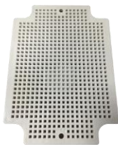
Placa interna (No incluida)